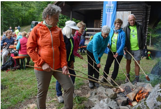
Besucher aus Bandol 2019 auf dem Schluchtensteig

Die „Randonneurs Pédestres de Bandol“ haben uns im Jahr 2019 besucht und endlich ist es so weit!!! Vom 28.Mai bis 3.Juni 2023 besuchen wir unsere Wanderfreunde aus Bandol. Es wird für jeden Wanderer passende Angebote haben, der Wanderverein Bandol wird für uns jeden Tag zwei unterschiedliche Angebote zusammenstellen. Merkt euch diesen Termin vor, falls ihr Interesse habt und gegebenenfalls. Urlaub planen müsst. Alle Interessierten können sich bei Familie Ramsteiner melden. Ein unverbindlicher Infoabend findet am Montag, 09. Januar 2023 um 19 Uhr in unseren Vereinsraum statt.